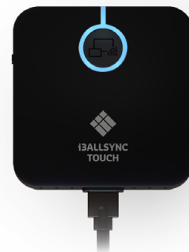
USB C ZENDER

Op i3TOUCH-panelen is de i3ALLSYNC-software ingebouwd, dus je hebt geen ontvanger nodig.